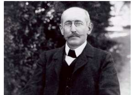
אלפרד דרייפוס בגני וילרמארי 1899 תמונת היכן ומתי