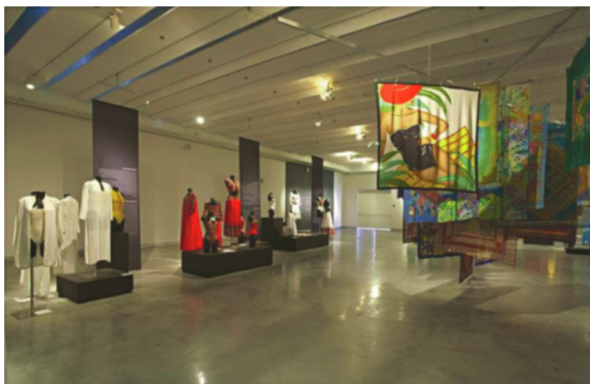
2 מבט על התערוכה "הגברת עם החרציות: מחווה ללאה גוטליב", מוזיאון העיצוב חולון.