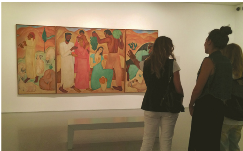
4 מבט על תערוכת הקבע של האמנות הישראלית במוזיאון ישראל, שבה נראית היצירה "פירות ראשונים" (ראובן רובין, 1923).