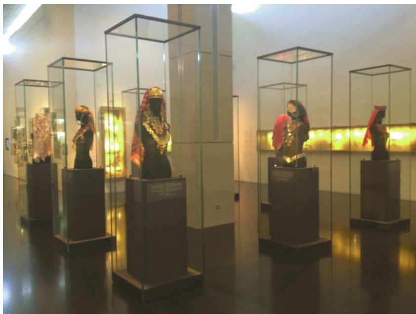
1 מבט על התערוכה "לבוש ותכשיטים: שאלה של זהות", מוזיאון ישראל. צילום: נועה חזן, 2016